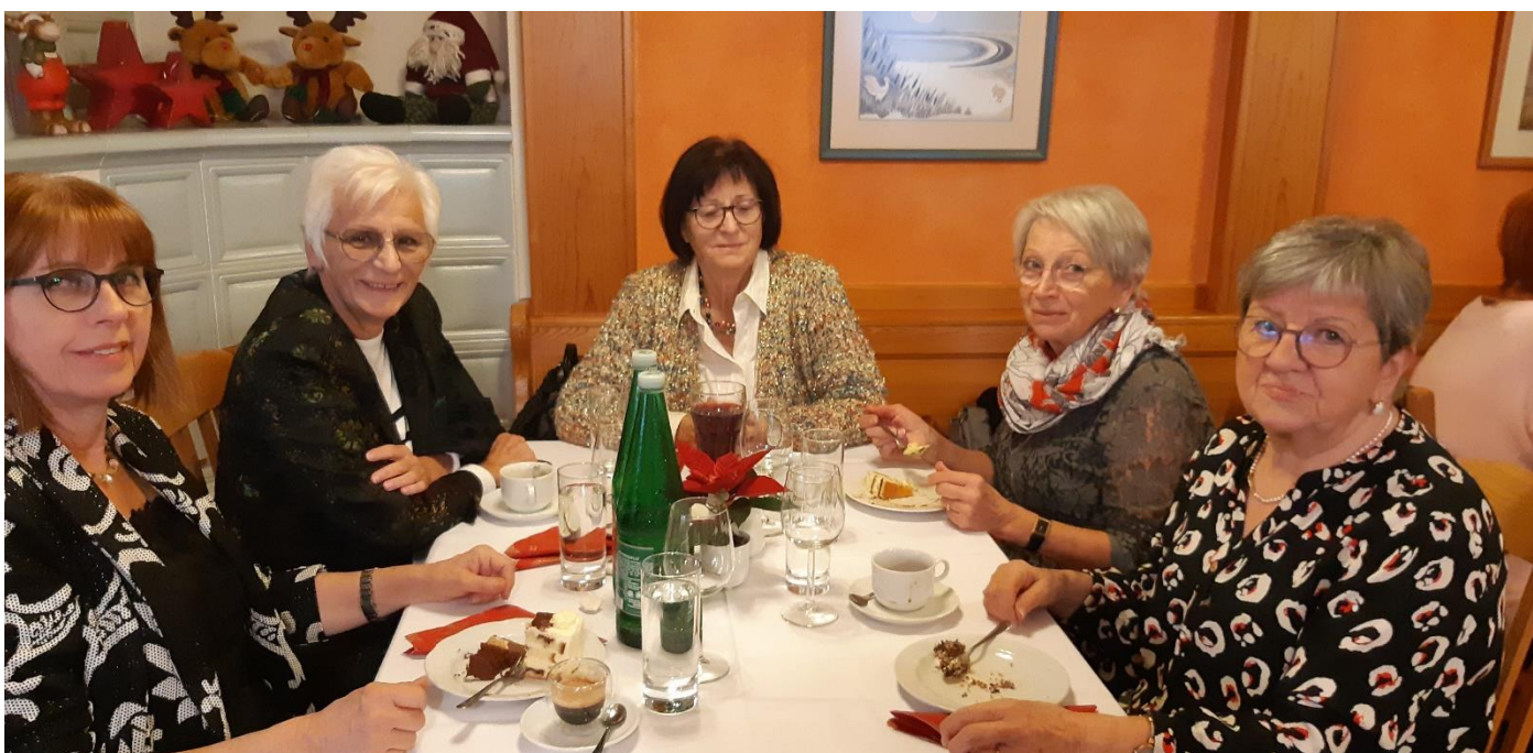
Bildtext: Recht gut unterhielten sich die Gäste auf unserer Weihnachtsfeier

In diesem Sinne wünschen wir ein gesegnetes Weihnachtsfest, alles Gute im neuen Jahr, vor allem aber beste Gesundheit.