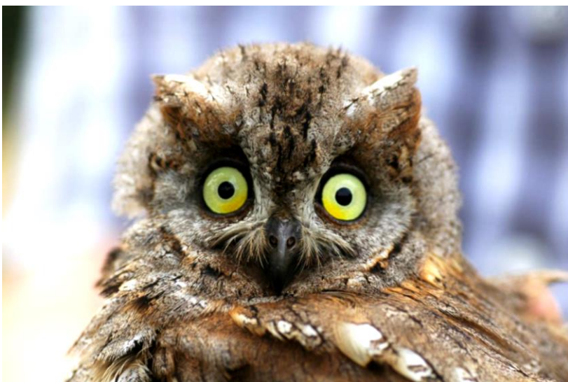
Fotocredit: © Zwergohreule Kurt Grafl

Im praktischen Teil zeigte der Experte den Bau eines Nistkastens. Dabei wurde genau erklärt, worauf man achten muss: die richtige Materialwahl, Größe, Einflugöffnung, Schutz vor Nesträubern und die passende Anbringungshöhe. Die Teilnehmer konnten die Arbeitsschritte genau beobachten und wertvolles Wissen für eigene Nistkastenprojekte mitnehmen.