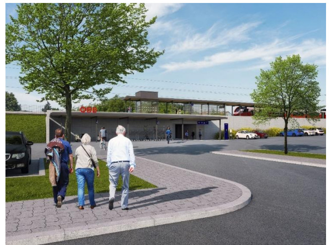
Fotocredit ÖBB/Feuchtenhofer Architekten

Die ÖBB-Infrastruktur AG attraktiviert und elektrifiziert die Bahnstrecke von Wr. Neustadt über Mattersburg nach Loipersbach-Schattendorf. Seit Oktober 2025 laufen die Hauptarbeiten. Voraussichtlich ab Dezember 2027 fahren Züge dort dann umweltfreundlich und klimaschonend mit 100 Prozent grünem Bahnstrom. Außerdem wird es dann möglich sein, Züge bis nach Wien – ohne Umsteigen in Wr. Neustadt – durchzubinden. Das spart Zeit und bringt mehr Komfort für Fahrgäste.