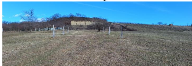
Fotocredit: Naturpark Rosalia-Kogelberg (Projektfläche) Donatuskreuz in Marz